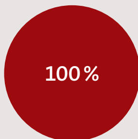
Hausfrauen und Hausmänner